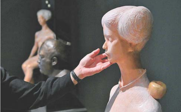
さわれる芸術作品を集めた民博の特別展「ユニバーサル・ミュージアム」=11月30日まで開催予定。...