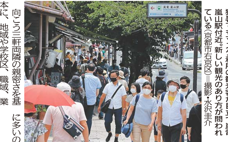
猛暑でもマスク着用の観光客が目立つ嵐電嵐山駅付近。新しい観光のあり方が問われている(京都市石京区)。 DMO 観光による地方創生の推進母体。国が支援し、官民一体で透明性の高い運営を進めて収益を目指す仕組み。今年4月には観光庁が、DMO登録制度のガイドラインを作成した。海外先進地の事例も参考に、DMOの役割や取り組み内容の明確化などを求めている。京都府内では、「梅」「森」「お茶」などを軸とする組織が発足している。