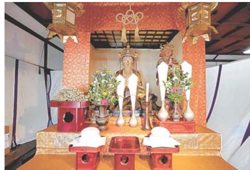
柳観音坐像。右脇は駄夫立像

堂目 閉じているように感じているカネナさんもいます。山田 閉じているように感じているカネナさんもいます。山田 閉じているように感じているカネナさんもいます。